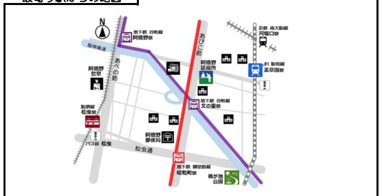
最寄り駅からの略図

地下鉄〇〇駅1番出口を出て西に300M。〇〇交差点を北に50M歩いたところにある〇△ビルの4階です。